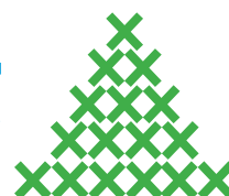
WYSOKA SMAKOWITOŚĆ – ZWIĘKSZENIE POBRANIA PASZY