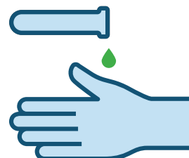
HIGIENA OSOBISTA OBSŁUGI